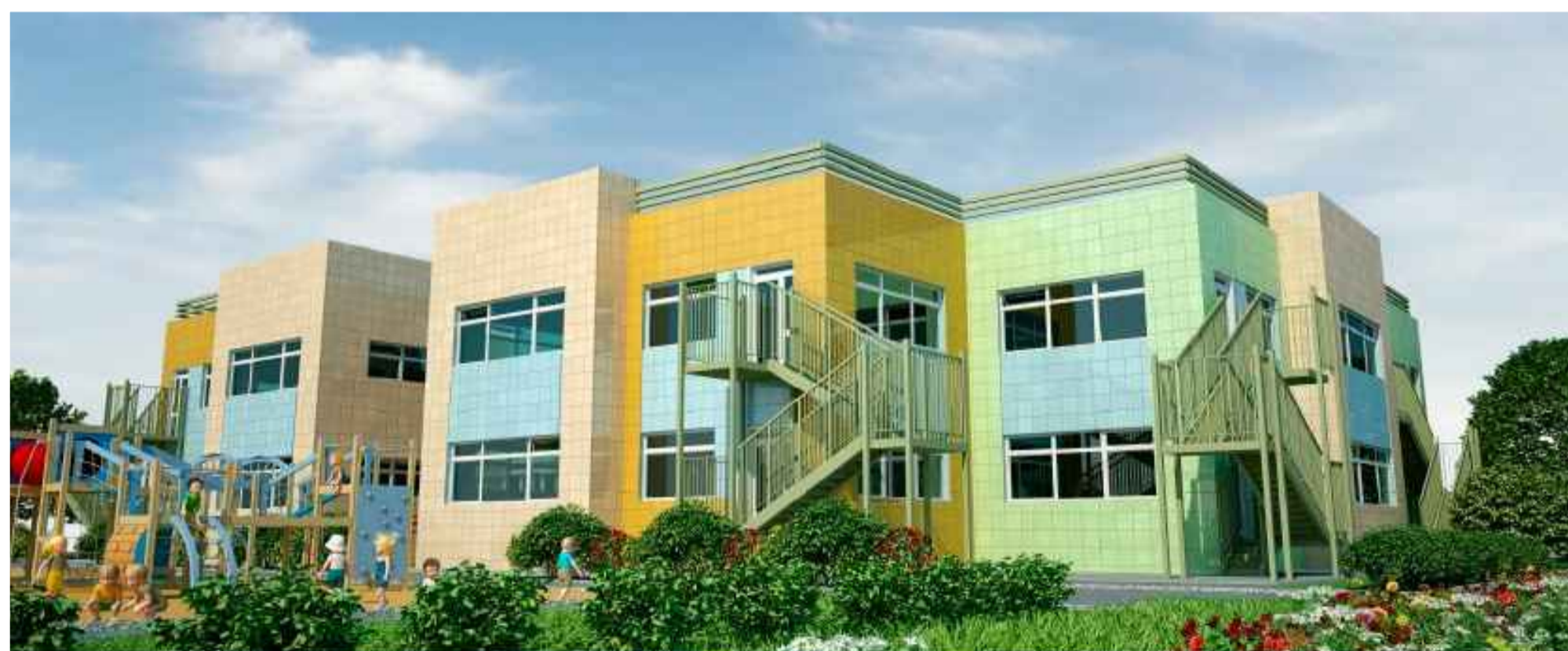
Пристройка к детскому дошкольному учреждению на 140 мест.